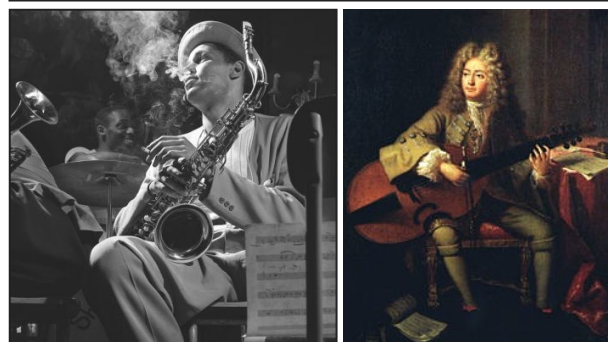
Dexter Gordon, Royal Roost, New York City, 1948